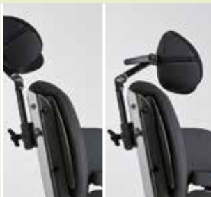
Kopfstütze (in Höhe und Winkel)