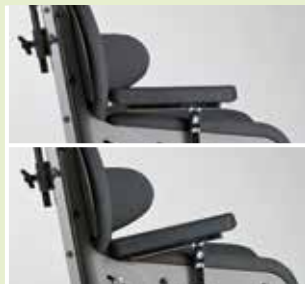
Armlehnen (in Höhe und Winkel)